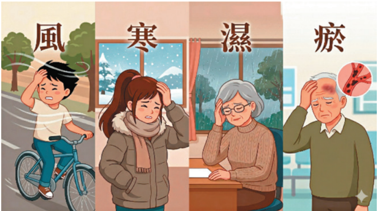
中醫對常見頭痛、頭暈的體質觀察與調理有其獨到之處，「風、寒、濕、瘀」是比較常見類型。（圖片由AI生成）

在中西醫結合的診間裡，我們嘗試打破這個循環。中醫治病最講究「因人而異」與「因時制宜」。在問診時，我常會細心觀察病人的生活規律與環境感應。