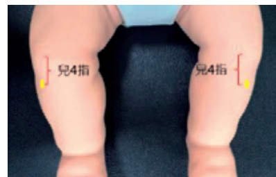
圖3：足三里：位於小腿前外側，在外膝眼下三寸處。