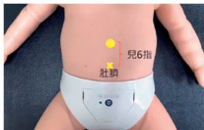
圖1：中脘穴：前正中線上，肚臍上方四寸處（四指寬），也就是肚臍和胸骨下端連線的中點。