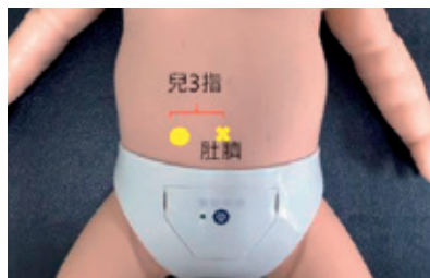
圖2：天樞穴：肚臍左右旁兩寸（約孩子三指併攏寬）。