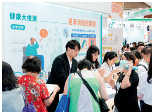
本次展區規劃「健康大檢測－失智風險解碼」活動，提供與失智症相關的ApoE基因檢測，協助民眾了解自身罹患失智症的潛在風險。