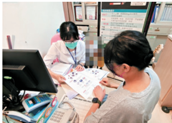
透過衛教諮詢了解照顧失智症的照護技巧及政府資源。

此次來諮詢衛教師，是因為她觀察到父親開始出現認知功能退步的徵兆，近半年頻出現找不到個人物品、忘記要做什麼、想講話卻困難表達、服藥遺漏、新事物學習顯得困難、服藥需提醒並需協助擺放到藥盒等狀況，經由神經專科醫師門診評估過後確診為失智症。衛教師同理員工身為照顧者的內心焦慮，先傾聽她目前面臨的主要問題，並開始一一提供失智症相關衛教知識、照顧技巧及政府資源。