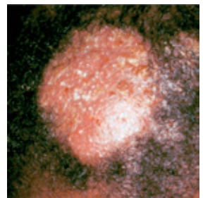
如果發炎嚴重，則會產生膿癬（Kerion）。

頭癬的臨床表現有非常多種，常見的表現有頭皮發紅、禿髮、脫屑，有時候會有一些小膿胞，輕微一點的病人外觀可能會看不太出來，仔細