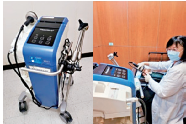
體外震波治療有助緩解疼痛。