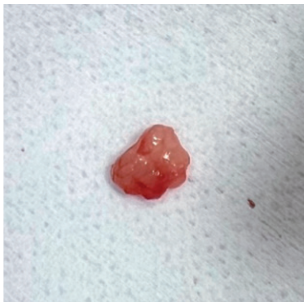
好發於指甲甲床的脈絡球腫瘤是罕見的良性腫瘤，典型症狀是異常疼痛。