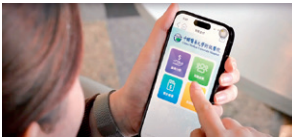
病人及家屬可透過使用中醫大附醫「中國E點通」、「阿佩支付」APP，一機掌握掛號、看診及費用支付等就醫流程，縮短等候時間。

2022數位健康指標DHI全球前三及2023 HIMSS戴維斯卓越獎等國際智慧醫療頂尖大獎，成為唯一榮獲戴維斯卓越獎的台灣醫院，也是2023年唯一來自亞洲獲此殊榮的醫院，並受到400多家國際媒體的報導。