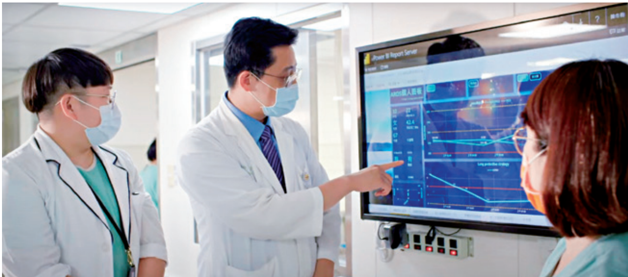
本院加護病房透過AI智慧監測系統，醫護人員可隨時掌握患者生理數據，把握搶救黃金期。

2022數位健康指標DHI全球前三及2023 HIMSS戴維斯卓越獎等國際智慧醫療頂尖大獎，成為唯一榮獲戴維斯卓越獎的台灣醫院，也是2023年唯一來自亞洲獲此殊榮的醫院，並受到400多家國際媒體的報導。