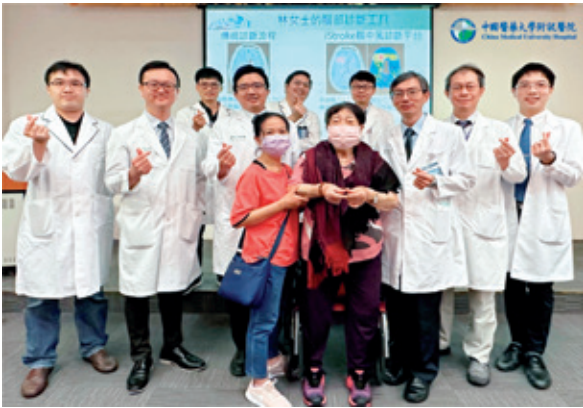
神經部團隊啟用「iStroke腦中風診斷平台」縮短分析時間使病患可及時取出大動脈血栓之案例。