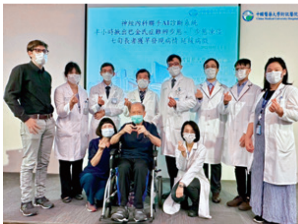
巴金森氏症治療團隊運用智慧醫療輔助即時診斷。

此外，我們還結合了具有混合實境（MR）功能的Microsoft Hololens2頭戴式裝置，即時錄製病患的連續步態影片，並迅速同步到電腦進行深度學習訓練和判讀。在省去設置攝影機時間的同時，我們提供了臨床醫師AI自動生成的步態凍結的時間分割數據。有了AI分析報告的輔助，大幅提升診斷效能，醫師可以迅速找出帕金森病患，並及早進行手術介入或藥物治療等醫療處置。