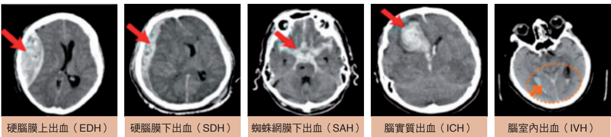
五種顱內出血與出血點位置示意圖。

另一方面，腦出血是一種急性腦血管疾病，其發病過程緊急而迅速，屬於最具致命風險的類型之一，這種情況主要發生在年齡介於40至70歲的患者。腦出血可能由外傷、高血壓、血管疾病或腦部腫瘤等引起。根據出血的原因，我們可以將其分為以下幾類：高血壓引起的腦出血、動脈瘤破裂引起的腦出血以及動靜脈畸形引起的腦出血等等。此外，根據出血發生的位置，腦出血可以進一步分為下圖不同的類型：