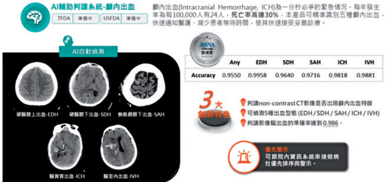
顱內出血AI輔助判讀系統示意圖。