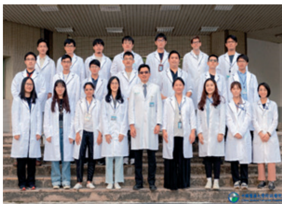
本院人工智慧中心研發團隊。