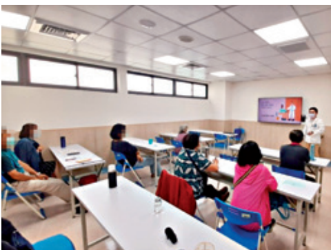
照顧者支持團體由心理師帶領放鬆技巧。