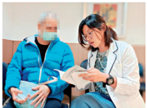
個管師進行治療照護衛教。