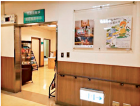
癌症資源中心位於本院癌症中心2樓。