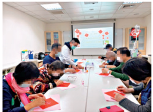
病房創作調劑身心。