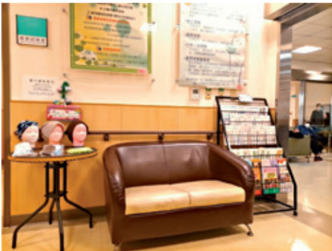
各類資源及衛教單張及康復用品展示。