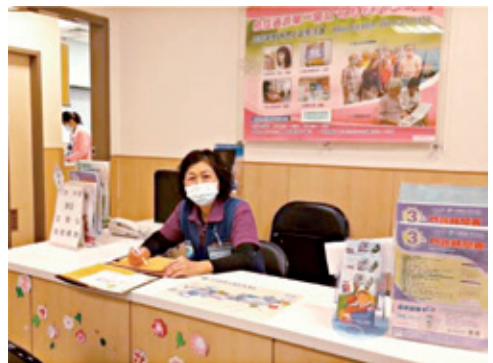
志工提供情緒支持與陪伴。