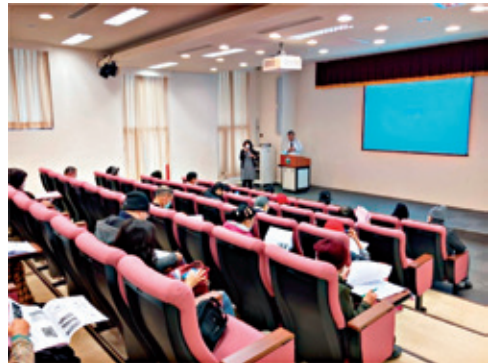
疾病健康講座提供病友正確照護知識。

本院癌症資源中心是一個不斷成長的單位，當發現現有的資源無法解決、滿足病友的問題及需求時，我們必須再發掘、連結、擴大社區資源網絡，以協助病友及家屬渡過困境，落實全人、全程、全方位的關懷，成為抗癌路上的最佳夥伴。期盼病友經疾病洗鍊後所蘊藏的堅毅與勇氣，可以傳遞無限的希望，同時也鼓勵更多病友在抗癌路上，繼續勇敢前行。🕊