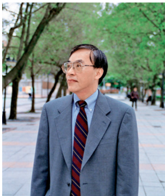
2002年許教授返台接任台北醫學大學校長，留影於擔任北醫校長時期。