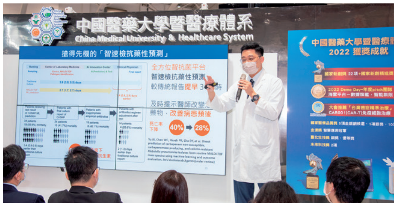
「醫師聊健康」講座，由20位醫療專家與民眾面對面暢聊醫療趨勢。

每年的台灣醫療科技展不僅是醫療界的年度盛事，更是全台一年一度最盛大的健康派對！本屆隨著疫情解封，觀展人數亦突破新高，展覽現場也更加熱絡，本院展區除了聚焦創新醫療6大亮點，眾所矚目的「醫師聊健康」現場講座，更排除萬難邀集本院逾20位獲獎醫療專家，一連4天齊聚展覽會場與觀展民眾面對面，暢聊醫療趨勢與最新療法，用最近的距離、最直接的方式守護大眾健康，參與民眾收穫滿滿深獲好評，以行動展現中醫大暨醫療體系以病人為中心的理念。🌐