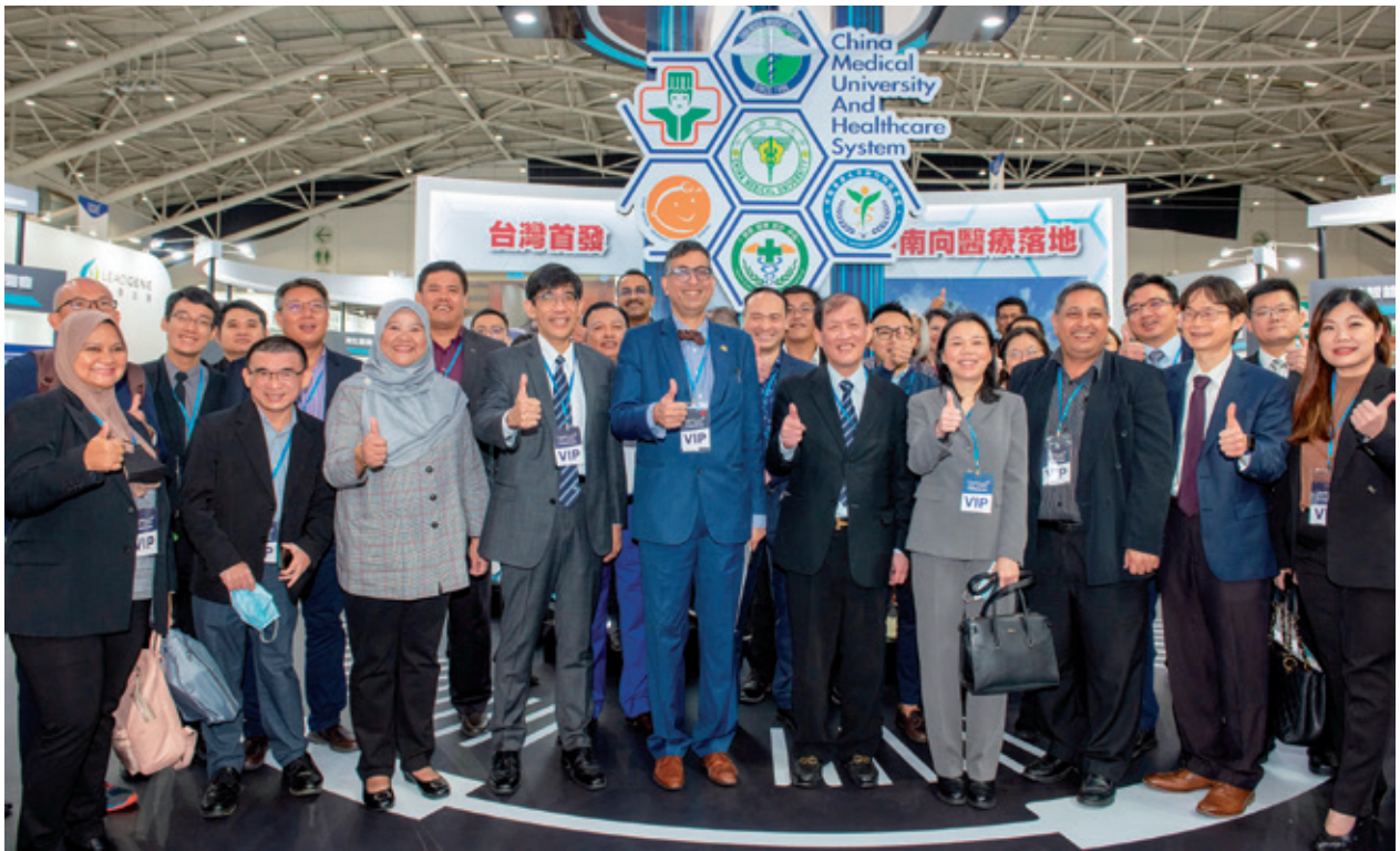
本院積極推動衛福部「一國一中心新南向計畫」，將台灣數位醫療轉型的經驗、技術與產品推廣至新南向國家。

展場設於4樓M607攤位，聚焦創新醫療6大亮點，包括「再生醫療」、「AI醫療」、「精準醫學」、「國際醫療」，「中醫大研究」以及「得獎專區」，現場發表多項研發成果與臨床實績得獎作品，包括國家新創精進獎與國家新創獎共榮獲22項為歷年最多、「海雲平台：亞洲最大的臨床－基因－環境資料的大數據整合平台」、「台灣癌症精準治療－CAR-T免疫細胞治療」、「抗癌INSP，奈米標靶技術」更特別獲得大會強力推薦焦點，以及榮獲國家新創精進獎等6項大獎的「智抗菌平台－打擊院內超級細菌、精準投藥救治病人」等亮點得獎項目，加上衍生企業長聖、長佳等多家尖端醫療的生醫產業，一同展出豐碩醫療成果。